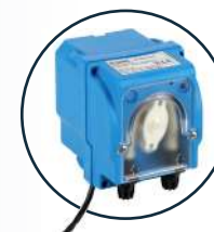
Peristaltiche per lavastoviglie

Per assicurare il massimo risparmio, i nostri prodotti vengono venduti in formule concentrate e per questo possono essere diluiti con acqua in maniera precisa. Le apparecchiature che utilizziamo per l'erogazione dei prodotti adottano un sistema che permette il dosaggio e la diluizione dei concentrati in maniera totalmente automatizzata: