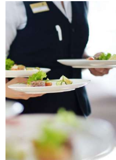
AZIENDE DI CATERING