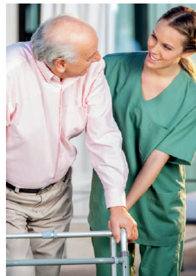
CASE DI RIPOSO