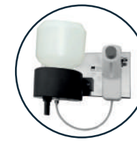
Soluzioni e impianti per detersivi solidi concentrati