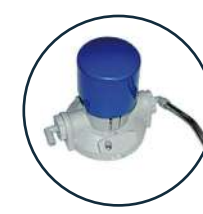
Sistemi a pressione per detergenza piatti