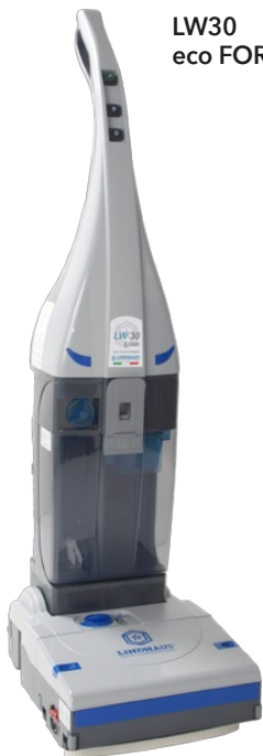
LW30 eco FORCE