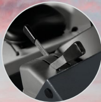
Leve ad azionamento meccanico