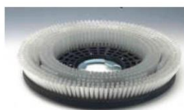
spazzola di Nylon