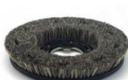
spazzola di cocco