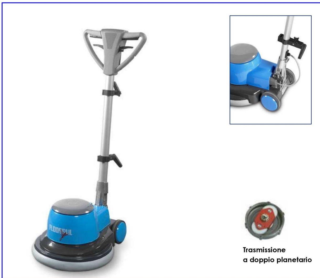
Trasmissione a doppio planetario