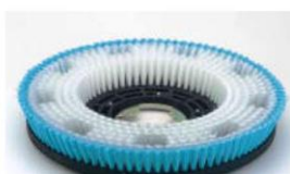
spazzola per tappeti