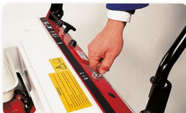
Scuotitore elettrico Electric filter shaker Sacudidor de filtro eléctrico