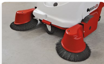
Braccio spazzola laterale sinistro Left side brush arm Brazo lateral izquierda