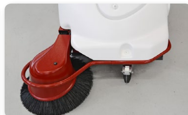
Paraurti Bumper Parachoques