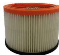
▲ Filtro a Cartuccia