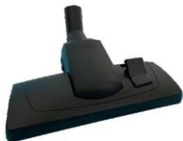
▲ Testa Spazzola