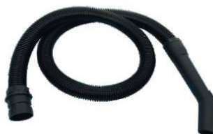
▲ Tubo Flessibile