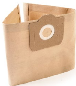
▲ Sachetto in carta per Aspiratore P13 e Silent Baby CF 10 PZ Cod. APP.R/FI002C10