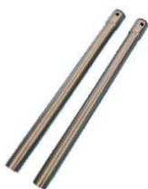
▲ Tubi in Metallo