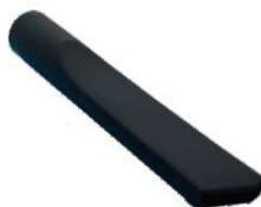
▲ Spazzola a Fessura