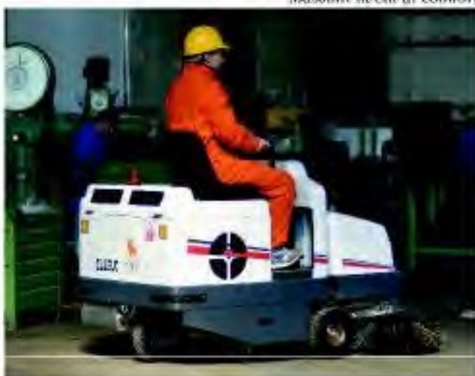
Massimi livelli di comfort