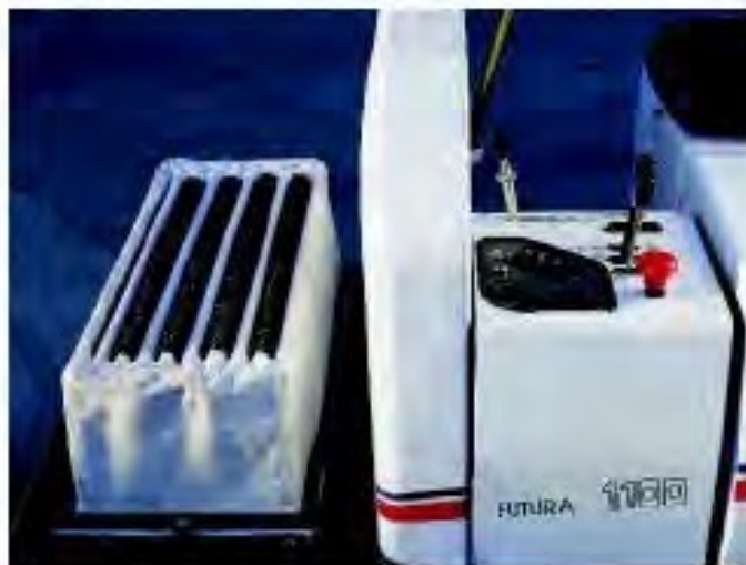
Sistema filtrante brevettato