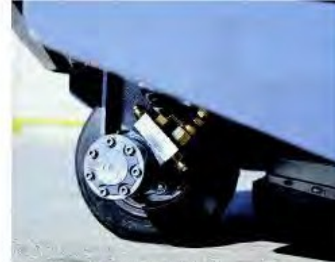
Trasmissione diretta con motoruota

La Dulevo 1100 FUTURA è estremamente maneggevole: può invertire la direzione di marcia con una sterzata di circa 1,1 metri di raggio (secondo le norme CUNA).