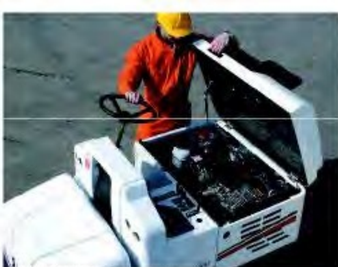
Facilità d'accesso al vano motore