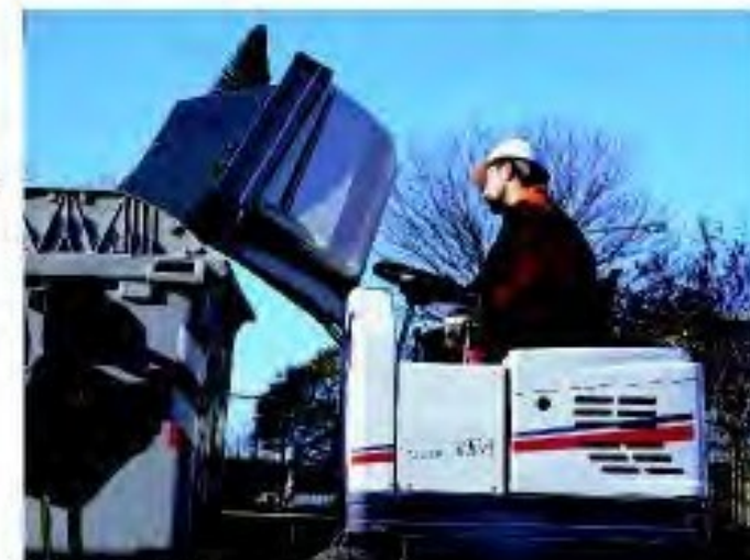
Scarico in quota