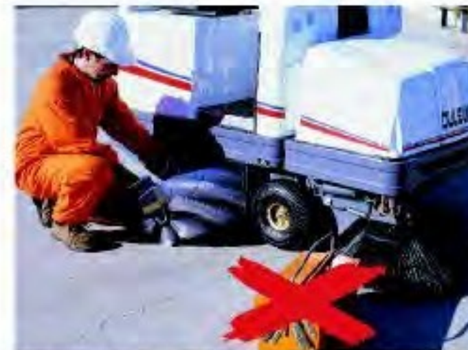
Smontaggio della spazzola centrale senza l'utilizzo di attrezzi