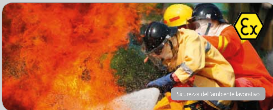
Sicurezza dell'ambiente lavorativo