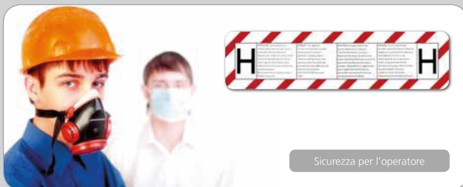
Sicurezza per l'operatore