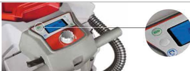
Pannello comandi Antea 50 BT