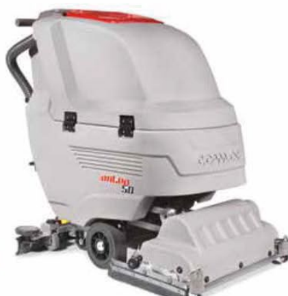
Antea 50 BTS