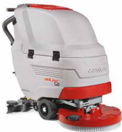
Antea 50 B/BT