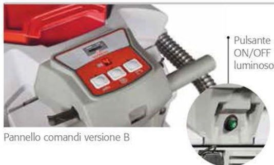
Pannello comandi versione B