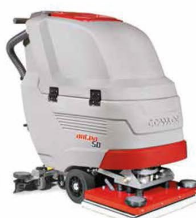
Antea 50 BTO Orbital