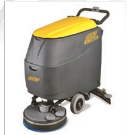
Gel / Acido: Taratura di Fabbrica

La lavasciuga pavimenti S1 45 M 45 ECO è caratterizzata da una manovrabilità eccellente e da un'estrema sicurezza d'uso in ogni condizione di lavoro. È una macchina dal design ergonomico, solida, potente ed affidabile. La versione 45 M 45 ECO BC PLUS è caratterizzata dalla presenza a bordo di caricabatterie e di due batterie al gel. È una macchina dal design ergonomico, solida, potente ed affidabile. Maniglione di guida regolabile. Cruscotto semplice e intuitivo. Controllo livello liquidi nel serbatoio tramite sensori. Caricabatterie a bordo (optional). Manutenzione ordinaria e straordinaria facilitata. Elettrovalvola di serie.